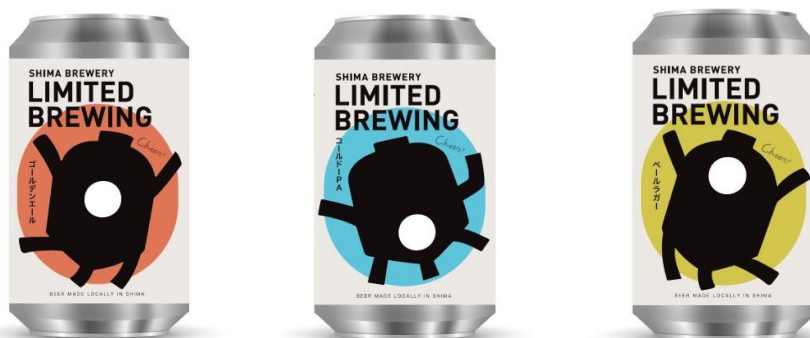
(志摩醸造オリジナルクラフトビール)