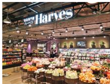
ハーベスリンクス梅田店

大阪・梅田のヨドバシカメラと一体になった複合商業施設「LINKS UMEDA」（大阪市北区）の地下1階に位置し、新鮮な生鮮品はもちろん、「Harves クオリティ」と銘打ったこだわり商品や種類豊富な弁当・惣菜など、2019年11月のオープン以来多くのお客様にご利用いただいています。