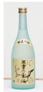
純米吟醸 三重の寒梅