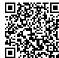
奈良市買い物支援HP