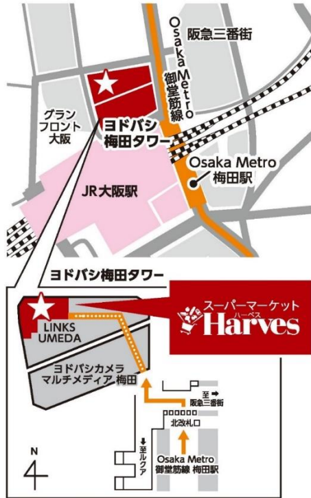
(7) 当店へのアクセスマップ