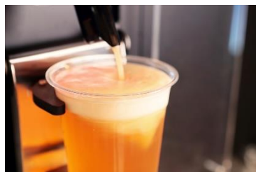
大和醸造 クラフトビール 550円

(9) 販売商品：全て税込表示、取り扱い商品の一例であり、予期なく変更することがあります。