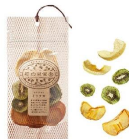
堀内果実園 セミドライミックス 1,100円