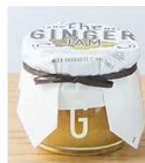
UNE TABLE ジンジャージャム 320円