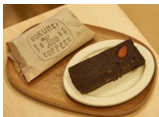
ロクメイコーヒー ブラウニー 440円